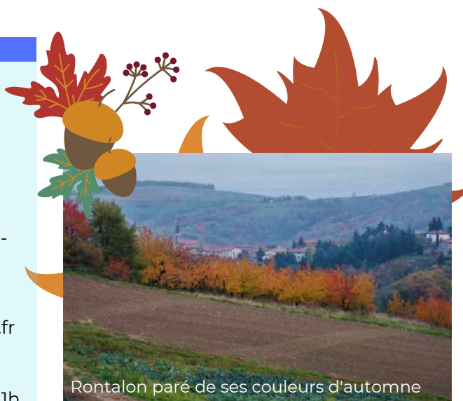
Rontalon paré de ses couleurs d'automne