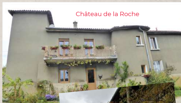
Château de la Roche

Jean-Claude Buyer pour "Culture et Traditions" Dominique Monge pour le P'tit Alanqué