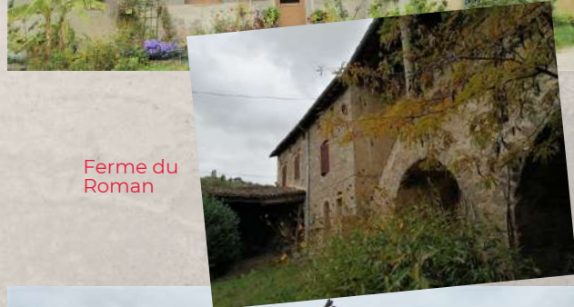
Ferme du Roman